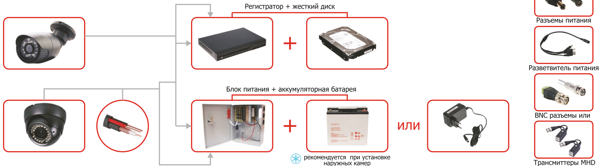
Схема для установки