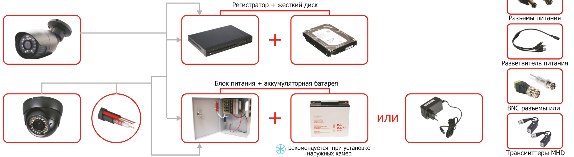
Схема для установки