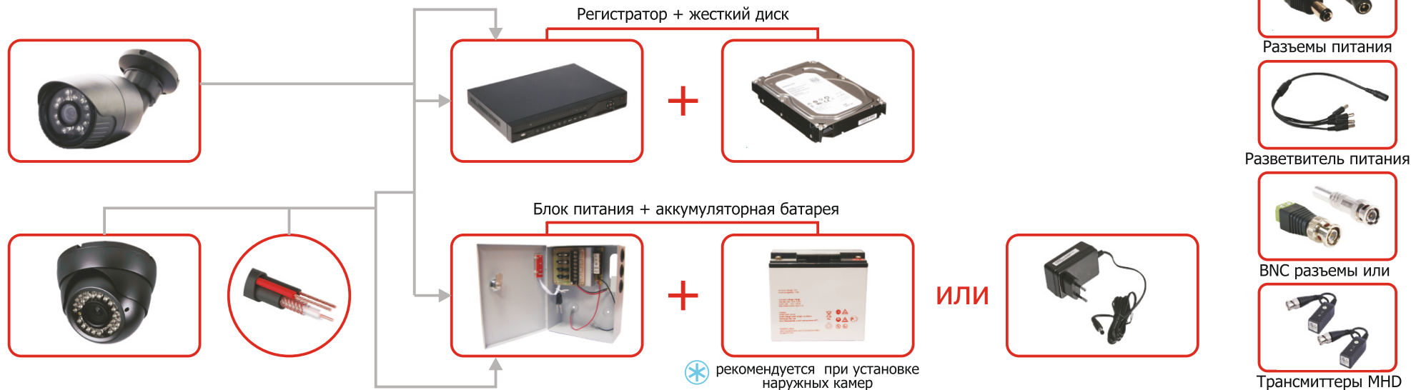
Схема для установки