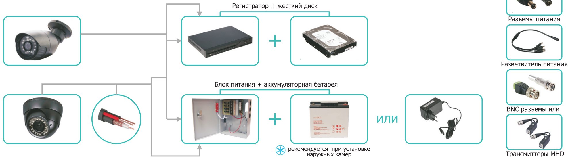
Схема для установки