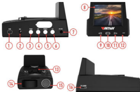
СХЕМА КОМБИНИРОВАННОГО УСТРОЙСТВА ARTWAY