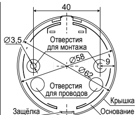
Рис.3 Задняя стенка. Расположение отверстий для монтажа. Присоединительные размеры

Величина оконечного резистора R ок определяется в соответствии с техническим описанием ППКП