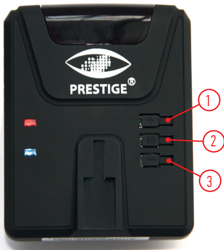
СХЕМА УСТРОЙСТВА РАДАР-ДЕТЕКТОРА И ОРГАНОВ УПРАВЛЕНИЯ