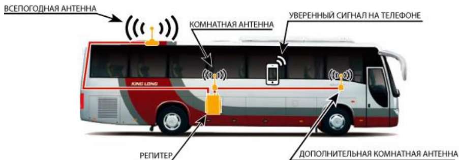
Схема №1. Пример установки репитера в автобусе.

Репитер представляет собой высокочувствительный двунаправленный СВЧ-усилитель сотового сигнала, поэтому при его установке нужно, чтобы всепогодная и комнатные антенны были хорошо изолированы друг от друга и не возникло самовозбуждения репитера. Чтобы на наглядном примере понять, что такое самовозбуждение, возьмите, к примеру, микрофон и громкоговоритель и поднесите их близко друг к другу – вы услышите очень сильный шум. Репитер будет работать бесперебойно только в том случае, если электромагнитная развязка будет достаточной для устойчивой работы системы усиления сотового сигнала.