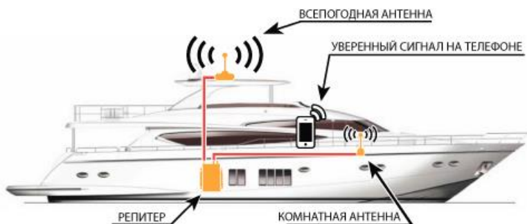
Схема №2. Пример установки системы усиления сотового сигнала на яхте.