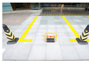
Управление частной парковкой